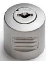
OLIVE TOURNANTE avec serrure DRAAIKNOP met slot