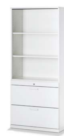
ARMOIRE COMBINÉE COMBIKAST