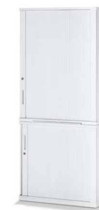
ARMOIRE COMBINÉE COMBIKAST

GRÂCE À LEUR DIVERSITÉ, LES FAÇADES S'HARMONISENT AVEC TOUS LES TYPES D'AGENCEMENTS ET DE PIÈCES. LES PORTES BATTANTES, LES TABLETTES, LES PORTES COULISSANTES, LES VOIETS LATÉRAUX ET LES TIROIRS SONT COMBINABLES EN FONCTION DES BESOINS ET FONT DE CHAQUE VARIANTE UN POINT DE MIRE. LA TRAME DE HAUTEUR MODULAIRE DE DEUX À SIX HAUTEURS DE CLASSEUR EST À L'ORIGINE D'UNE MULTITUDE DE CONFIGURATIONS DU VOLUME DE RANGEMENT. IL EST AINSI POSSIBLE DE PERSONNALISER LE POSTE DE TRAVAIL EN FONCTION DU VOLUME DE RANGEMENT NÉCESSAIRE.