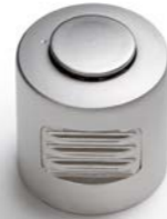
BOUTON TOURNANT DRAAIKNOP