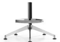
_8 Fünfsternfuss mit Fussbügel, Alu poliert, Rollen | Gleiter Piétement 5 branches avec repose-pieds, alu poli, roulettes | glisseurs