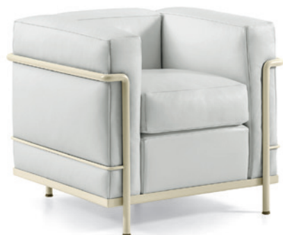
cod. 002 1R avorio / ivory / elfenbeinweiß / ivoire