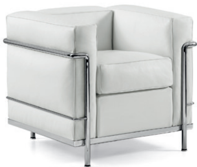
cod. 002 1C cromo / chrome / chrom / chrome