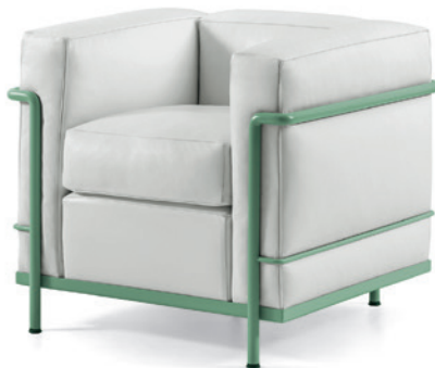
cod. 002 1V verde / green / grün / vert