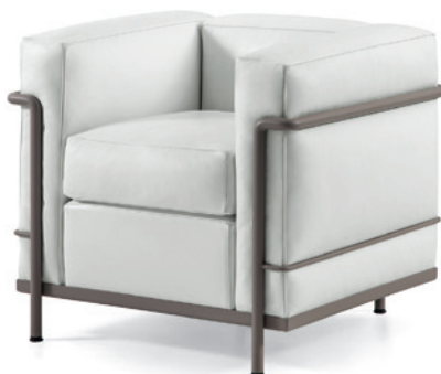
cod. 002 1F fango / mud / schlamm / taupe

poltrone, imbottitura in ovatta di poliestere, struttura cromata o verniciata, rivestimento in pelle bianca LCX 13X415