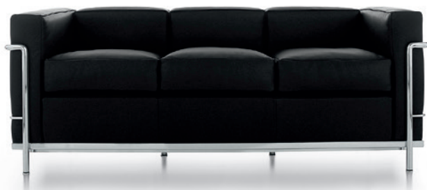
cod. 002 3C

divano 2 e 3 posti e pouf: imbottitura in ovatta di poliestere, struttura cromata, rivestimento in pelle grafito LCX 13X414