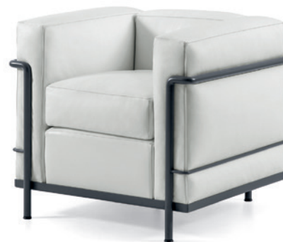
cod. 002 1G grigio / grey / grau / gris