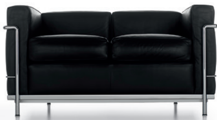
cod. 002 2C