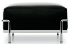
cod. 002 DC