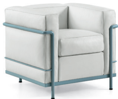
cod. 002 1A azzurro / light blue / hellblau / bleu