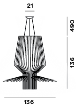
SCHÉMA ET ÉMISSION DE LUMIÈRE