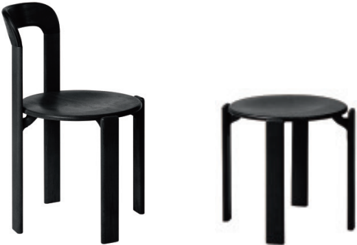
Chaise · Tabouret