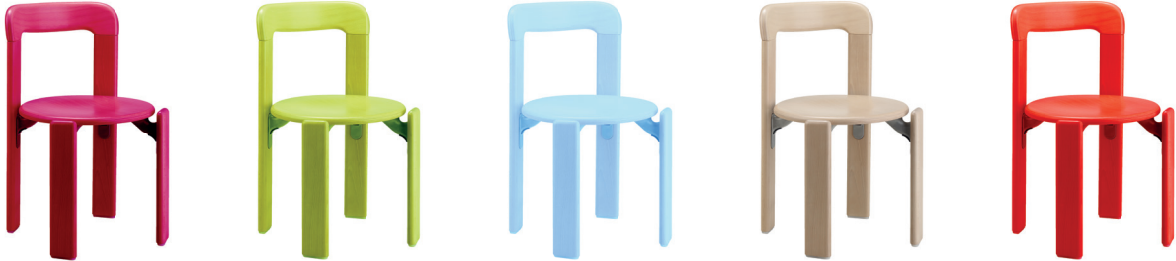
Chaise Rey Junior